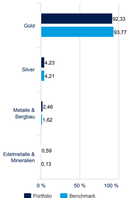
FONDSSTRUKTUR NACH SEKTOREN