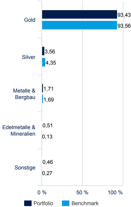
FONDSSTRUKTUR NACH SEKTOREN